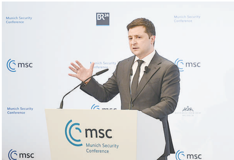
▲2022年2月19日,在德国慕尼黑,乌克兰总统泽连斯基在第58届慕尼黑安全会议(慕安会)上发言。

乌克兰总统弗拉基米尔·泽连斯基16日再次请求西方国家像保护以色列那样为乌克兰提供防空武器,并发问:难道以色列是北大西洋公约组织成员国吗?然而,就西方给予以色列和乌克兰“不同对待”,美国和欧洲联盟解释称,两者不能比。