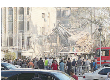
▲这是4月1日在叙利亚首都大马士革拍摄的空袭现场(手机拍摄)。

打击以色列的行动作出“灵活回应”。针对以方动向,萨法迪16日在德国首都柏林访问时作上述表态。