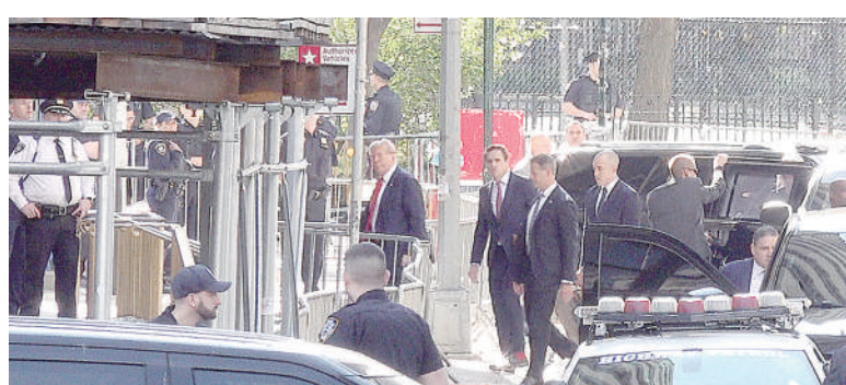
▲这张4月15日的视频截图显示,美国前总统特朗普抵达纽约曼哈顿一家刑事法院出庭。

当地时间15日上午10时许,美国前总统特朗普因“封口费”案出现在纽约曼哈顿一个刑事法庭被告席上,由此成为美国史上首位遭遇刑事审判的前总统。