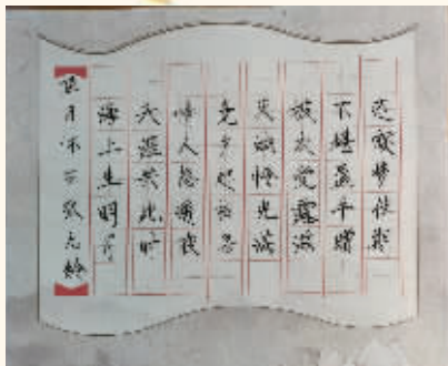
书法 403班 段宇曦