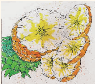
凤梨 304班 赵馨诺

最后，队长告诉我们，本次活动圆满成功了。我们为大凉山的小伙伴们筹集善款两千多元。通过这次活动，我得到了锻炼，也感受到了爱心的力量，能温暖冬天，让世界更加可爱！（指导老师 张星）