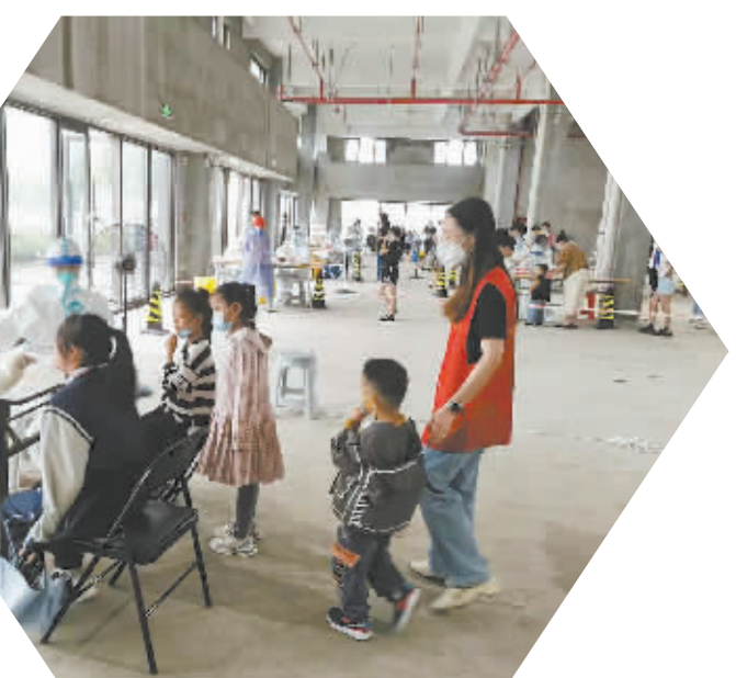
梨洲街道机关干部支援阳明街道做好核酸检测工作。

本报讯 （记者 张云霓）昨天，记者在宁波亚特电器有限公司看到，生产流水线上，工人们开足马力，赶制订单，现场一派忙碌景象。这是一家集研发、生产、销售于一体的制造业企业，主要有园林工具、电动工具、家电类产品等。截至8月底，该公司销售额达到2.16亿元，比去年同期增长24.8%。这是梨洲街道工业企业克服经济下行压力和疫情影响，实现逆势上扬的一个生动缩影。 今年，梨洲街道牢牢把握“稳中求进、稳中提质”的工作总基调，积极打造工业经济亮点，以超常规力度和举措推动街道经济企稳回升，为建设共同富裕示范街道添上“点睛之笔”。 百强企业，带动力逐步增强。今年，余姚经济开发区企业委托梨洲街道管理后，街道经济总量迅速膨胀。1月至7月，该街道160家规模以上企业实现工业总产值107.52亿元，同比增长4.10%，销售10.47亿元，同比增长2.95%，利润6.80亿元，同比增长21.96%；7家上市百强企业实现产值31.36亿元，占规模以上企业总产值的29.17%。金瑞薄膜、峻和科技、瑞成包装、丰茂科技等企业克服原材料价格居高不下、劳动力成本大幅上升等困难，积极调整产业结构，大力开发高档新产品，同时高度重视节能降耗和内部挖潜，使企业的运行质量有了较大提高。 项目投入，吸引力明显提高。梨洲街道牢牢抓住项目这个“牛鼻子”，以“快”字当头、“稳”字为要，第一时间对受托企业进行充分调研、走访，并与经信、发改部门对接，通过项目备案梳理排摸，及时掌握各企业工业投资项目情况。1月至7月，该街道有全社会固定资产投资41个项目（包括续建项目37个、新建项目4个），累计完成全社会固定资产投资6.51亿元，其中，工业投资完成5.35亿元，商贸投资完成0.65亿元，政府投资完成0.51亿元。今年新建的4个项目中，亿元以上项目1个，为总投资1.79亿元的宁波盈瑞聚合科技有限公司年产5万吨BOPET多功能薄膜生产项目。 “三大改造”，助推转型升级。梨洲街道深入实施绿色、智能、技术“三大改造”。今年，该街道积极组织峻和科技、耀泰电器、晟祺实业、金瑞薄膜等4家企业申报“绿色工厂”；申报智能化改造项目22个，总投资达2.2亿元；同时，技改投入增速迅猛，33个工业投资项目中，技改项目占31个，占工业投入比重的95%。该街道还积极引导企业加大科技创新力度，1月至7月，规模以上企业研发经费投入3.84亿元，同比增长11.37%，其中，宁波宇宁电器有限公司今年投入618万元，同比增长69.22%。 助企纾困，力度持续加大。梨洲街道加大指导走访力度，辖区160家规模以上企业均由街道领导带队对接，主要领导带队走访托管企业，在输送上级政策的同时，了解企业经营情况、人员结构、高新技术企业和“350”企业申报情况等，收集企业的实际困难、问题，以及对政府、街道的建议和要求。此外，政府推出用于企业工资发放全额贴息的“薪资保”业务，通过街道搭桥牵线，辖区共有25家企业列入“薪资保”企业“白名单”，授信额度达1.6亿元。