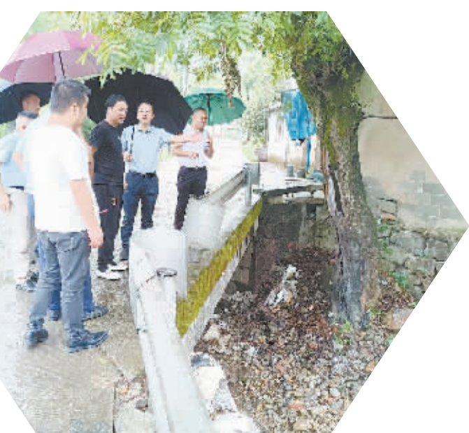
“轩岚诺”台风期间，梨洲街道党工委書記率共军带队赴三溪村、苏家园村等小流域山洪重点点位检查指导防汛防台工作。