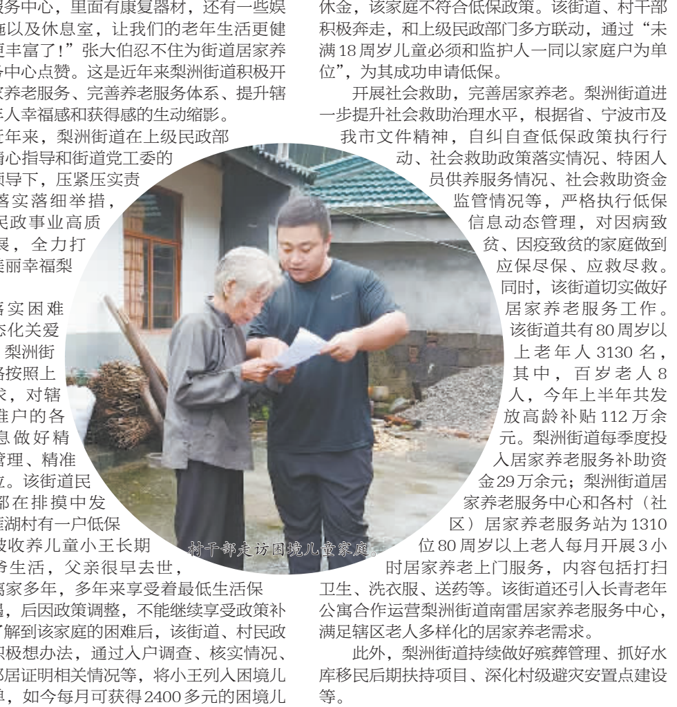
新丰镇慰问困难儿童。

本报讯 （记者 张云霓）上个月底，由梨洲街道选送的9名双合格青年在全市全民健身中心参加了由市军武部组织的择优定兵体能测试，并以优异的成绩完成本轮测试。接下来，他们将面临部队的挑选，到祖国最需要的地方实现自身价值。这是梨洲街道精准发力、扎实做好征兵工作的一个缩影。 近年来，梨洲街道聚力党管武装工作，在兵役征集、民兵建设、关爱退役军人等方面持续发力，不断推进基层武装工作高质量发展。征兵工作有力度。今年，梨洲街道完成兵役征集任务16名，这16人是通过村（社区）排摸、街道直测初检、市里上站体检，从500多名适龄青年中脱颖而出，包括大专以上毕业生9名、高校新生和在校大学生7名，大学生入伍率100%，大学生毕业生入伍率高达56%。这一成绩归功于街道干上下一心、赛马争先的工作责任感和使命感。上半年，该街道等各项工作突出中发挥着积极作用。为始终领导及时研究工作对策，调整工作思路，把握工作重点，确保工作成效。该街道参照全年的征兵工作指标，以联村领导为组长，联村干部和村（社区）干部认领工作指标，以片包干，深入排摸，确保工作落实到位，同时强化宣传引领，制作大型宣传广告12块，发送短信1000余条，悬挂各类横幅150余条，努力营造“一人参军、全家光荣”的良好氛围，有效吸引辖区优秀青年踊跃应征。 打造民兵应急队伍。今年5月，梨洲街道举行2022年民兵集合点验大会，基于民兵统一着装、整齐列队，以饱满的精神、昂扬的斗志庄严宣誓。该街道应急排基干民兵共有30人，是一支由辖区退役军人和部分优秀青年组建而成的基层力量，以“平时服务、急时应急、战时应变”为目标，着眼于新时局对民兵队伍建设提出的新要求，在疫情防控 and 防汛防台等各项突击工作中发挥着积极作用。为始终领导及时研究工作对策，调整工作思路，把握工作重点，确保工作成效。该街道参照全年的征兵工作指标，以联村领导为组长，联村干部和村（社区）干部认领工作指标，以片包干，深入排摸，确保工作落实到位，同时强化宣传引领，制作大型宣传广告12块，发送短信1000余条，悬挂各类横幅150余条，努力营造“一人参军、全家光荣”的良好氛围，有效吸引辖区优秀青年踊跃应征。 打造民兵应急队伍。今年5月，梨洲街道举行2022年民兵集合点验大会，基于民兵统一着装、整齐列队，以饱满的精神、昂扬的斗志庄严宣誓。该街道应急排基干民兵共有30人，是一支由辖区退役军人和部分优秀青年组建而成的基层力量，以“平时服务、急时应急、战时应变”为目标，着眼于新时局对民兵队伍建设提出的新要求，在疫情防控 and 防汛防台等各项突击工作中发挥着积极作用。为始终领导及时研究工作对策，调整工作思路，把握工作重点，确保工作成效。该街道参照全年的征兵工作指标，以联村领导为组长，联村干部和村（社区）干部认领工作指标，以片包干，深入排摸，确保工作落实到位，同时强化宣传引领，制作大型宣传广告12块，发送短信1000余条，悬挂各类横幅150余条，努力营造“一人参军、全家光荣”的良好氛围，有效吸引辖区优秀青年踊跃应征。