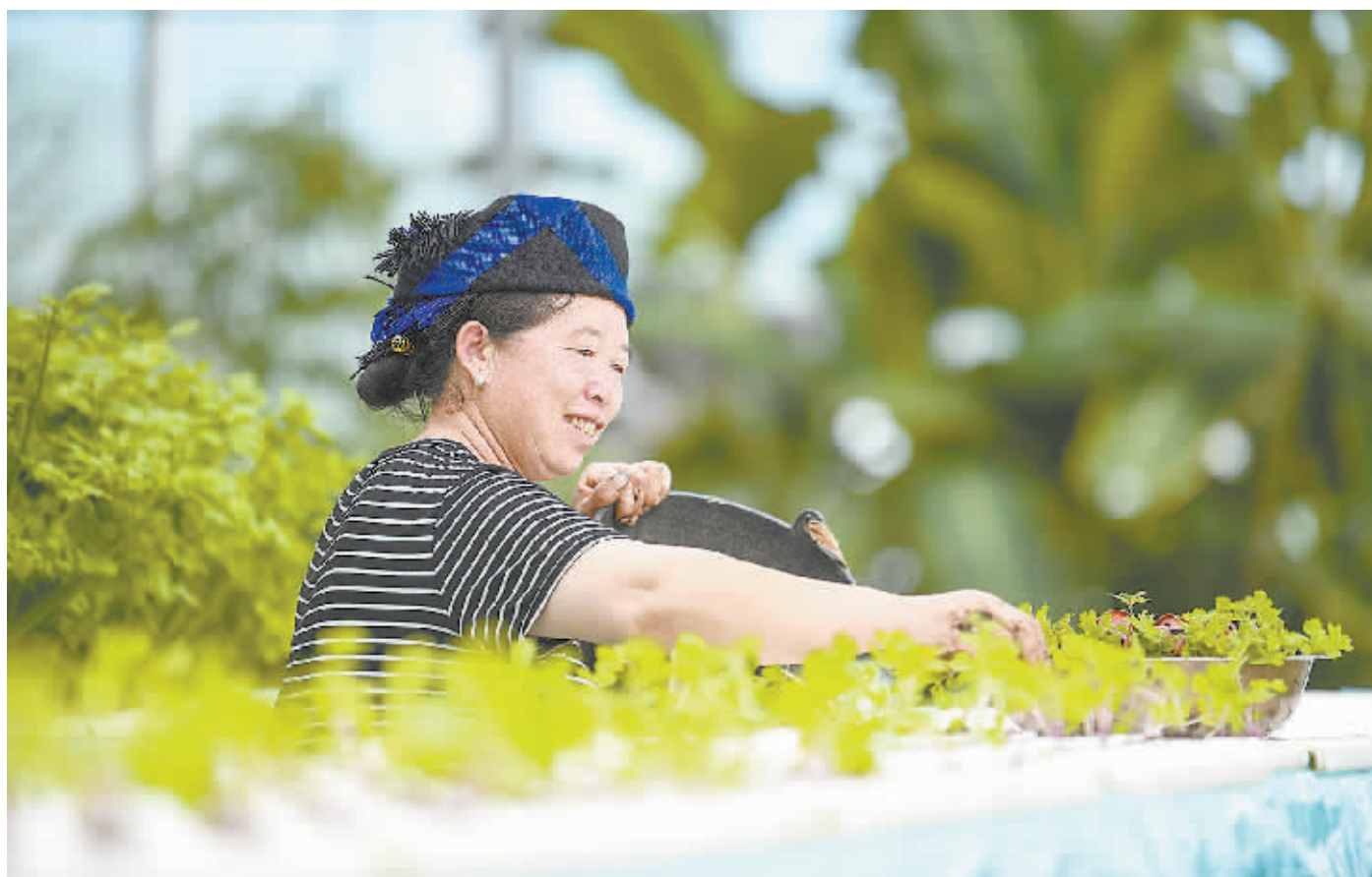
► 余姚出资建设的现代农业产业园内，彝族妇女正在管理大棚内的蔬菜。