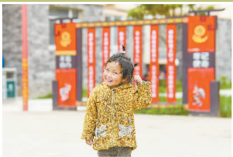
► 当地可爱的小孩，见到陌生人也会天真地笑。