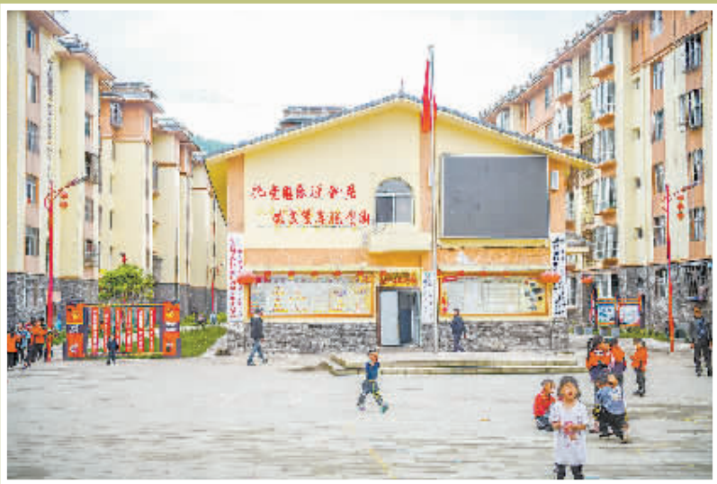
► 从山区迁移下来的彝族同胞在昭觉县的安置新区，干净整洁。