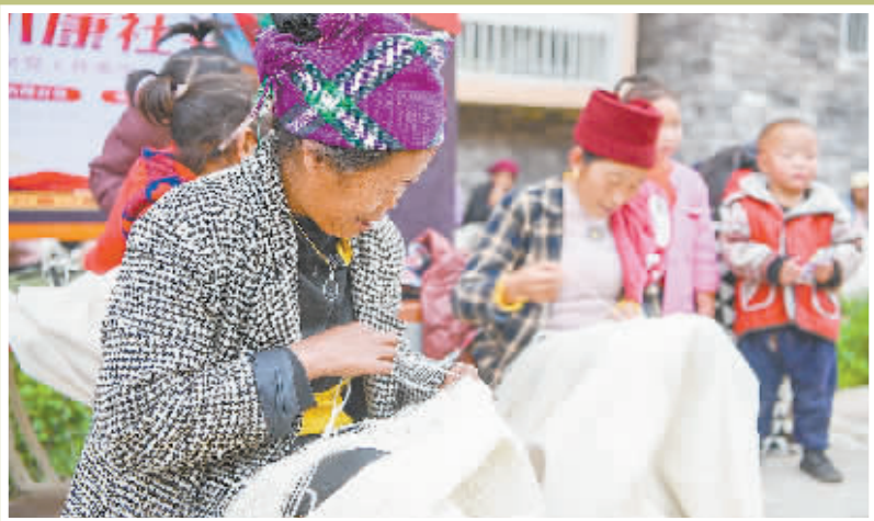
► 当地彝族妇女在编织传统服饰查尔瓦。