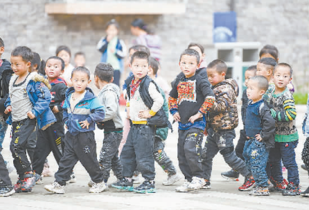
► 当地可爱的学生，放学时成群结队地出校门，对着记者的镜头又摆造型。